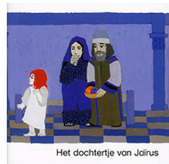
Het dochtertje van Jäirus

Jairus is verdrietig, zijn dochtertje is ziek, en gaat zelfs dood. Maar dan komt Jezus en gebeurt er een wonder.